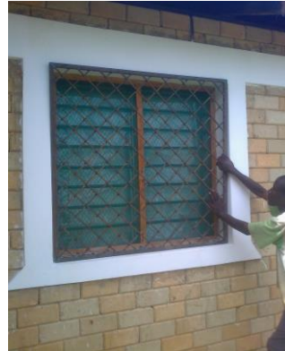
nieuw: de raambeveiliging