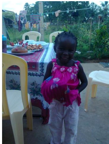
Rose begin september