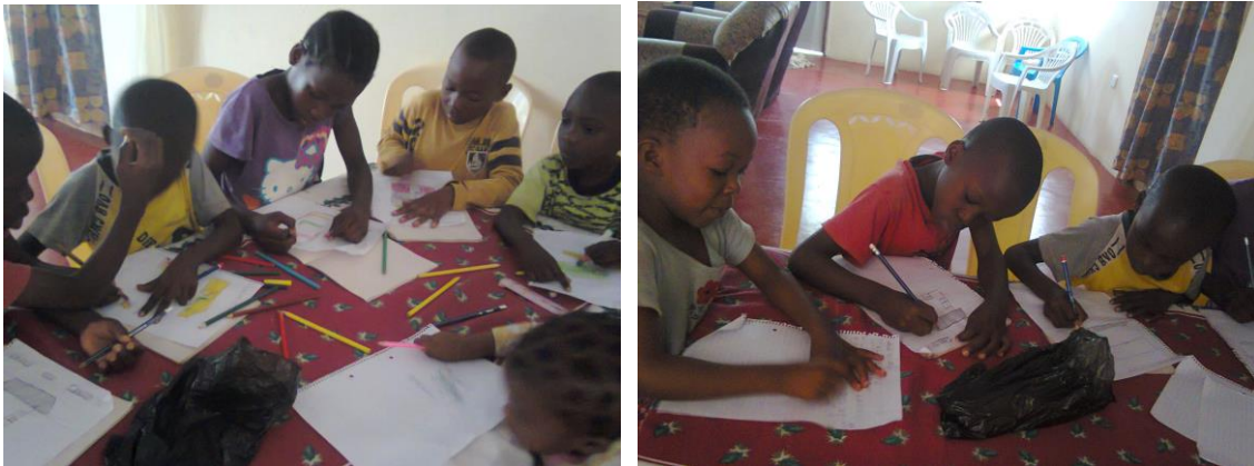
de kinderen maken tekeningen en brieven voor de kindsponsoren in Nederland

Inmiddels is er ook post onderweg vanuit Mombasa naar Nederland met brieven en tekeningen. We zullen deze post met de kerstpost die de kinderen straks maken in een keer naar jullie toesturen rond de kerst.