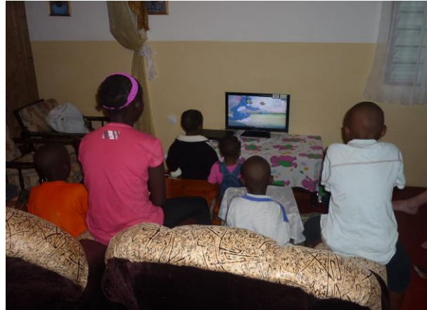
voor de tv met Tom & Jerry