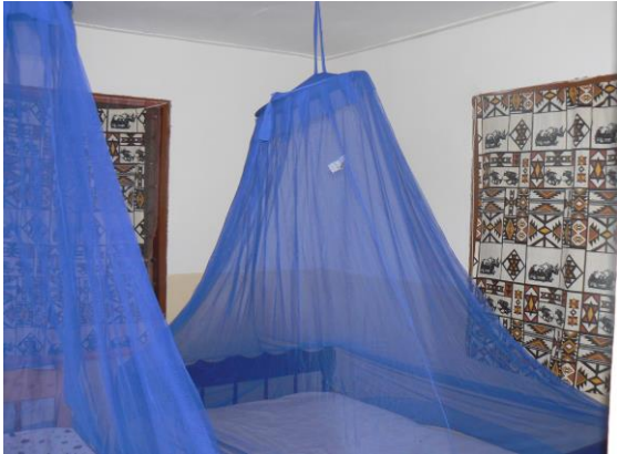
de klamboes zijn direct opgehangen

Mocht je iemand weten die belangstelling heeft, dan horen we dat graag! Je kunt deze nieuwsbrief bijvb. ook doorsturen naar derden.