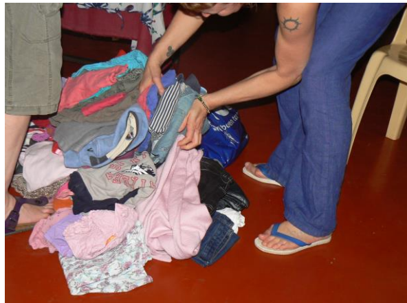
de meebrachte kleding uitpakken

De volgende dag zijn we de hele middag en avond bij en met de kinderen geweest. Van familie en vrienden hadden we nog wat extra geld meegekregen waar we rugzakjes, schoolmateriaal, boekjes, ballen, klamboes, regenkleding, etc van hebben gekocht.