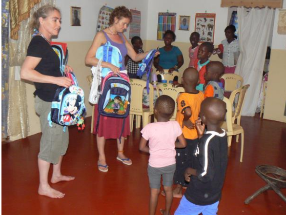
het uitdelen van de rugzakjes met inhoud.