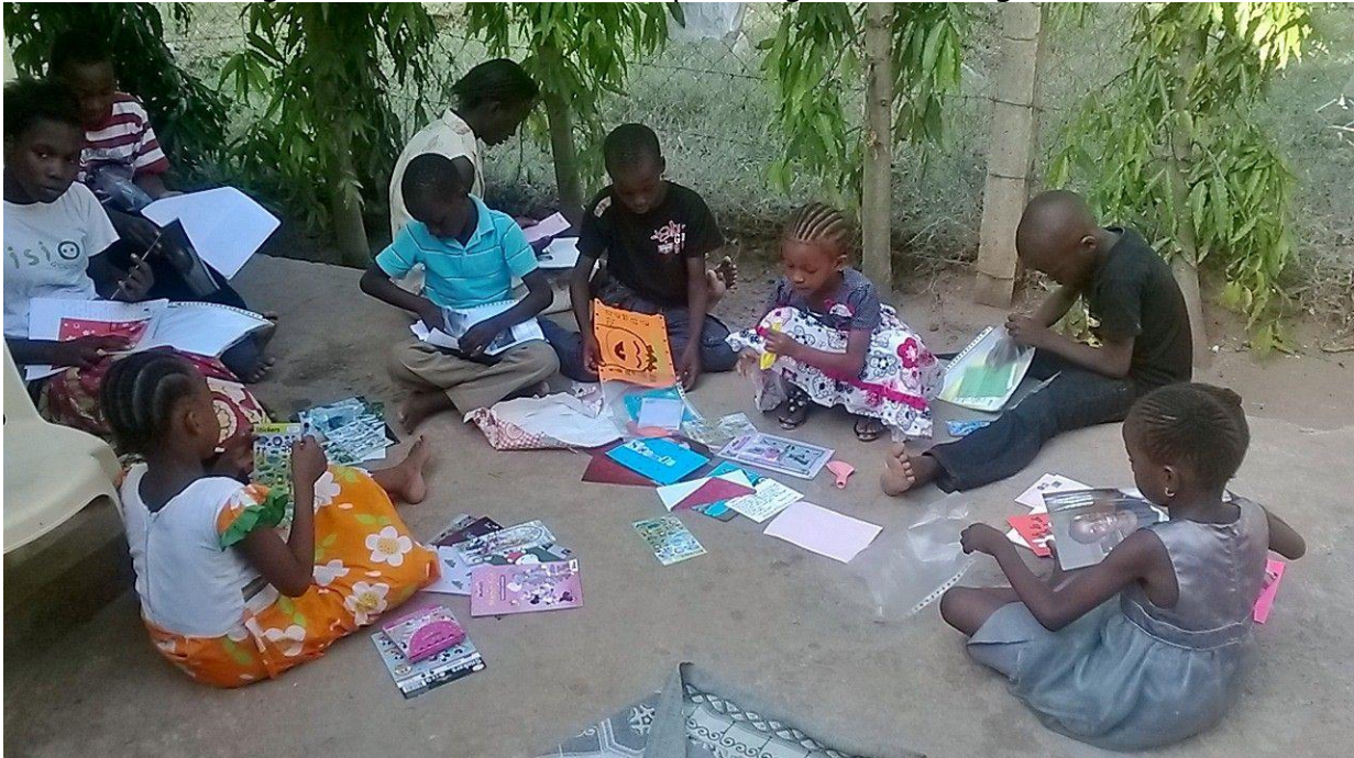
Op het plaatsje achter het gezinshuis samen de post open maken