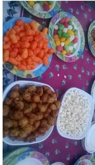
en nog meer lekkers ...