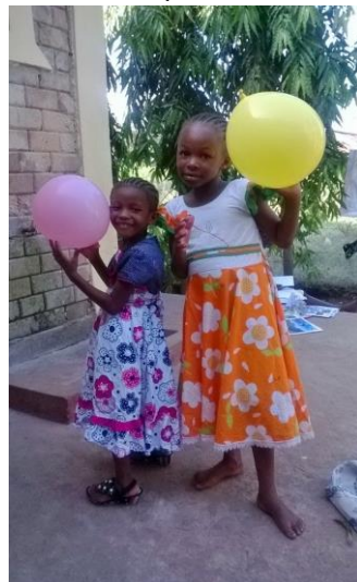
Shamim en Jemima