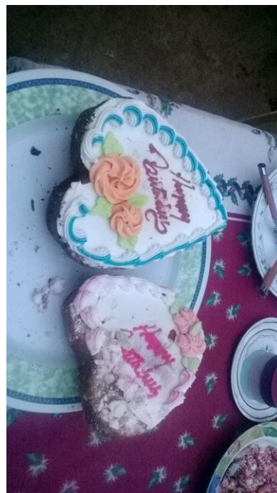
een "meisjes" en "jongens"taart