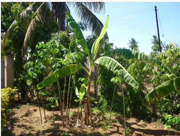
De tuin van het gezinshuis

Een van de kinderen vertelde ons bij vertrek dat dit de mooiste dag van haar leven was. Toen moesten we even slikken om onze tranen te bedwingen.